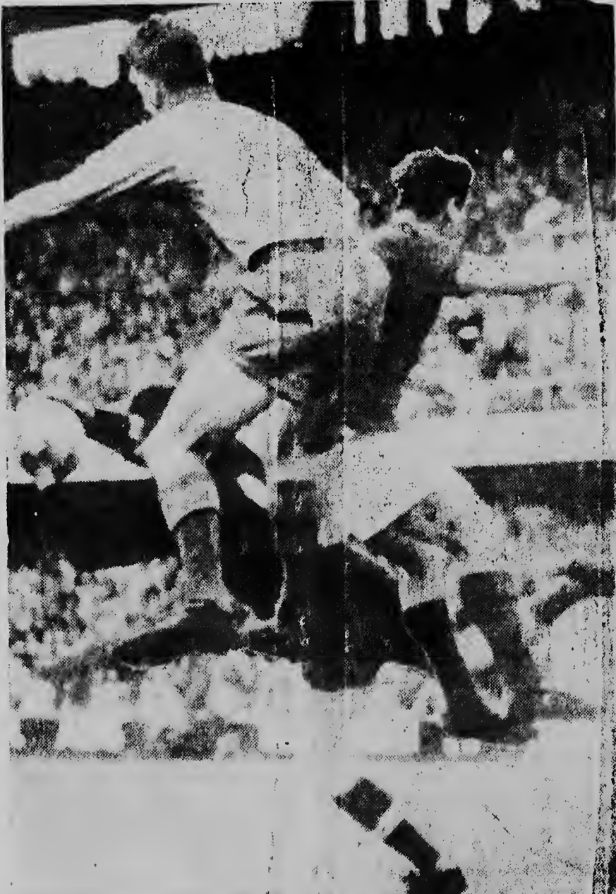
E keeper Hungaro Grosz aki ta na accion na momento di un ataque Sueco durante dje match cu a tuma luga Diahuebs anochi dia 12 di Juni na Stockholm pa e campeonato di futbol mundial entre Suecia y Hungria.